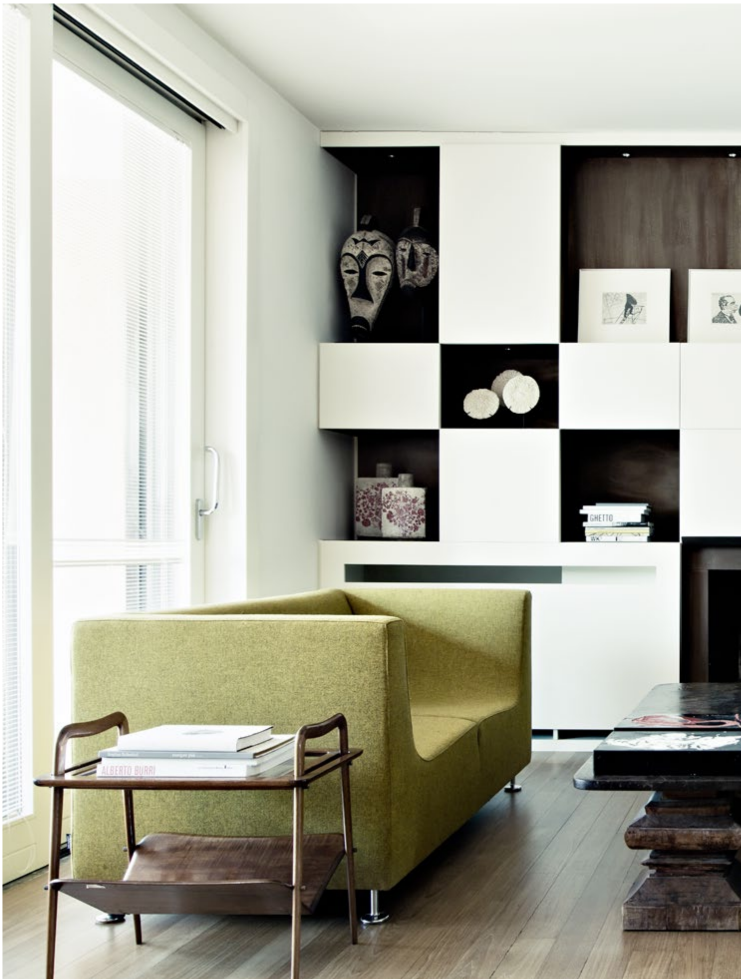
Goda samtal. Soffan i gult från italiensko Cappellini, den lila vintagesoffan inköpt på resa i Miami, Florida. Bordet är en unik pjäs av Ico Parisi. Väggen har ett schackinspirerat mönster.